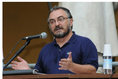
Figura 2: Andrea Moro

Andrea Moro è un linguista e neuroscienziato italiano. Moro è attualmente professore ordinario di linguistica generale presso la Scuola Superiore Universitaria IUSS Pavia dove è responsabile della Classe di Scienze Umane e coordinatore dei Corsi Ordinari. Si occupa prevalentemente di sintassi (campo nel quale ha dato contributi per la teoria della struttura della frase, in particolare rispetto alla nozione di copula e di espletivo e per la teoria del movimento sintattico e di neurolinguistica (fornendo contributi nella ricerca dei fondamenti biologici della Grammatica universale prevalentemente basati su tecniche di neuroimaging e sulla relazione tra la rappresentazione del mondo nel cervello e il linguaggio, esplorando in particolare la natura e gli effetti della negazione). [1]